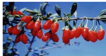
Tiré de EzNatural, 2009, 13 février.

S'il faut donc se méfier des allégations avancées sans un minimum d'explications correctes, il n'en reste pas moins que toutes les références mettent en avant le pouvoir antioxydant hors norme du fruit de Lycium barbarum.