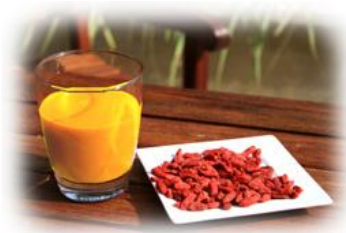
Tiré de : Gojimalaya, 2009, 13 février.

Bien que des études cliniques supplémentaires doivent encore être menées chez l'homme, le Goji semble bel et bien être un aliment exceptionnel et mériter sa réputation. Sa consommation peut être encouragée dans le but de prévenir l'apparition de nombreuses pathologies.